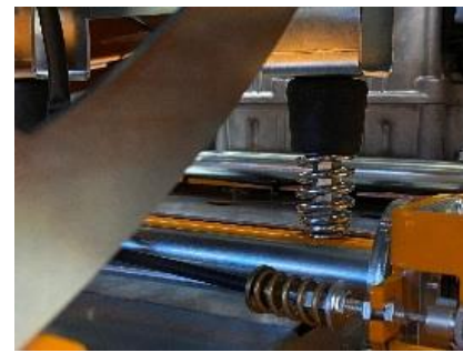
Bild 6: Spiralfeder einer Standard Sitzfederung (AS-Motor)

Bildnachweise: AS-Motor Germany GmbH & Co. KG